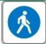
Знак "Пешеходная зона"