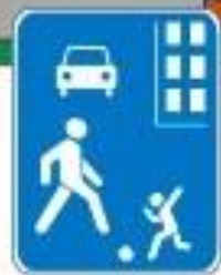
Знак "Жилая зона"

ПРАВИЛО 3: Не играй на проезжей части дороги даже во дворе собственного дома.