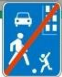
Знак "Конец жилой зоны"